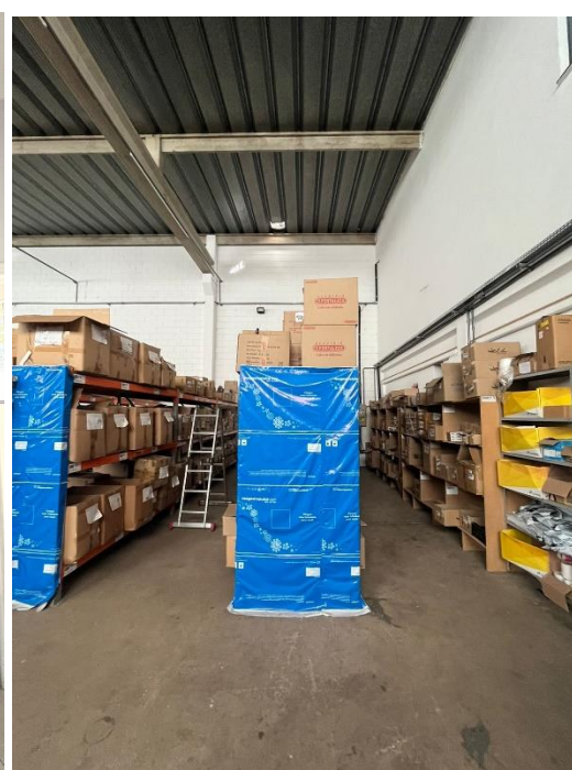
Estoque de produtos da Matriz - Americana/SP

Campinas/SP - Swiss Park Office Av. Antônio Artoli, 570 Sala 231, Bloco A Swiss Park Cep 13049-900 11-996261658