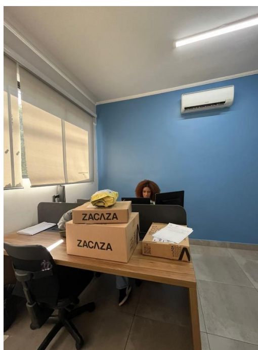
Matriz Administrativo com equipe trabalhando - Americana/SP